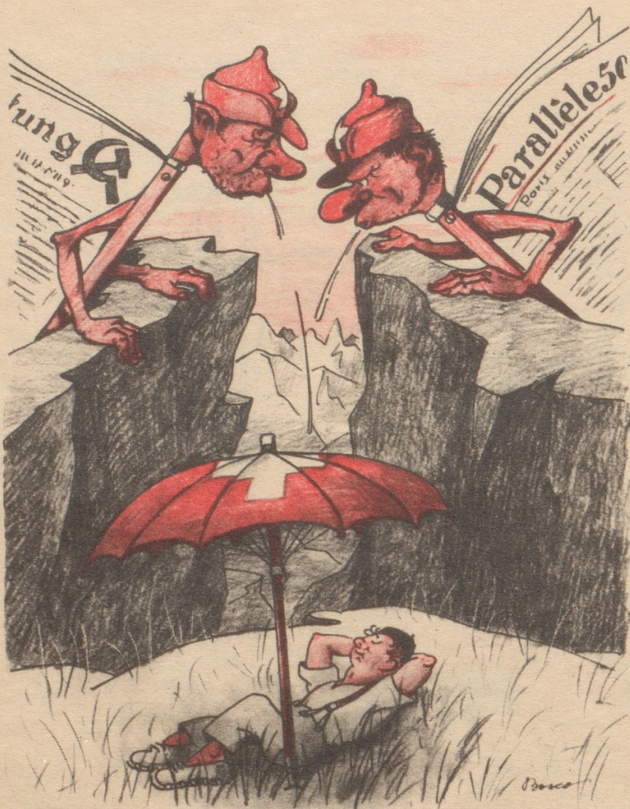
Auch die in Paris erscheinende kommunistische Zeitung „Parallèle 50“ speit im Zusammenhang mit dem Vitianu-Prozeß auf die Schweiz im allgemeinen und auf das Bundesgericht im besonderen.