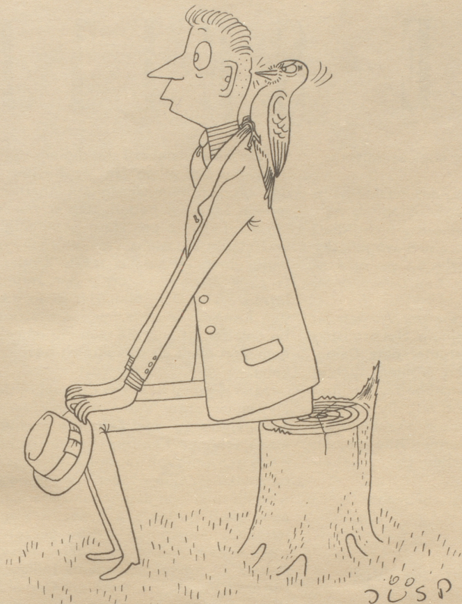
Specht an der Rinde