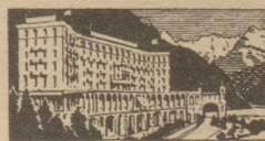
Willmann's Grand-Hotel Brunnen