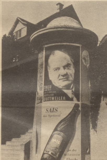
Les extrêmes se touchent

Eh Monsieur c'est Ebbe maintenant! (Der Gezeitenunterschied)