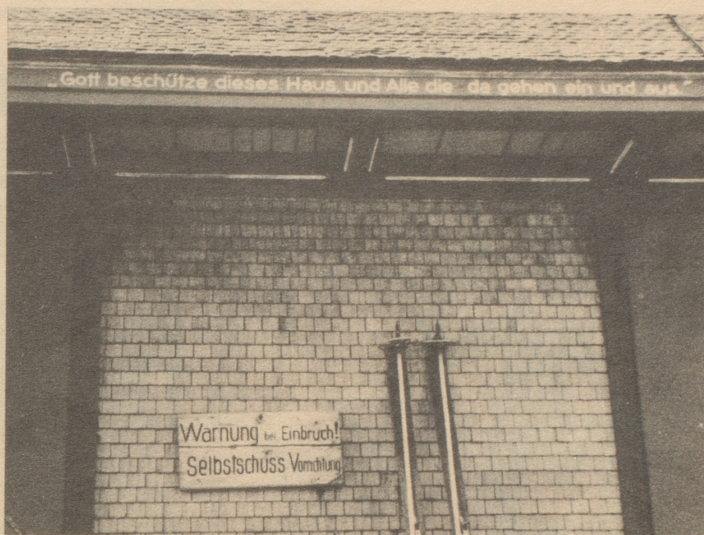
Gott und die Selbstschuss-Vorrichtung