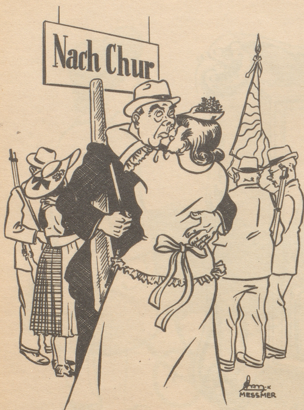
Gäll Guschti schüssescht nid mit andere Maitli umenand!