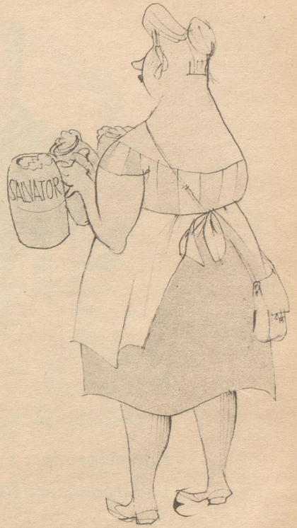
Saaltochter mit Saalvatter

Auf dem Perron des Zürcher Hauptbahnhofes stand eben der Zug nach dem Tessin zur Abfahrt bereit. Vor mir gingen zwei junge Damen den Wagen entlang, beide sehr aufgeregt einander Geschichten erzählend, in elegante graue Tailleurs gekleidet, Köfferchen in der Hand. Ganz offensichtlich fuhren sie in den Süden in die Ferien. Plötzlich ein Schrei aus dem