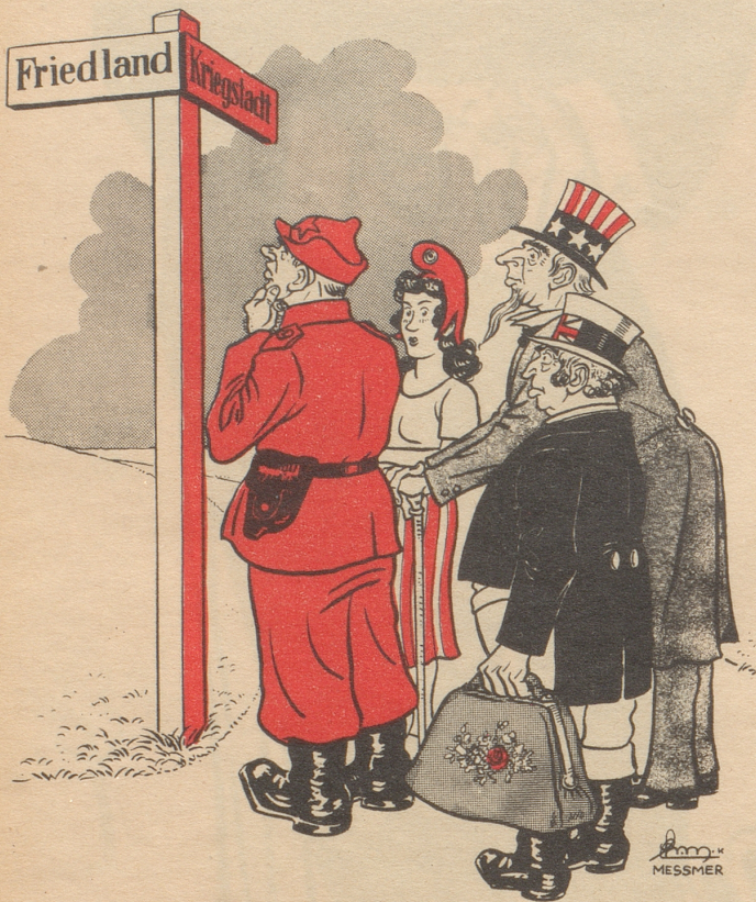
Am Scheideweg „Gehen wir links!“