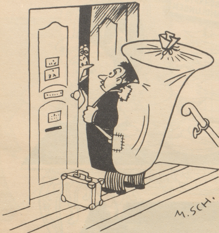
„Hänzi es absolut ruhigs Zimmer?“