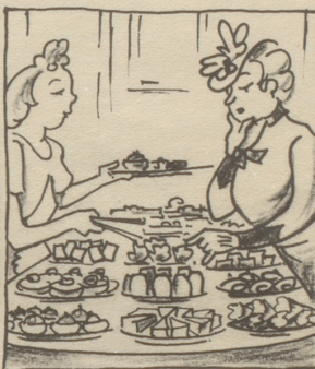
Nachdem die Predigt ist vorbei geht man in die Conditorei und kauft dort als ein braver Christ sich Stückli, weil es Sonntag ist.