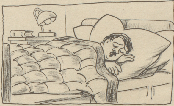
Gar viele fun das leider nicht, obschon es eine Bürgerpflicht.