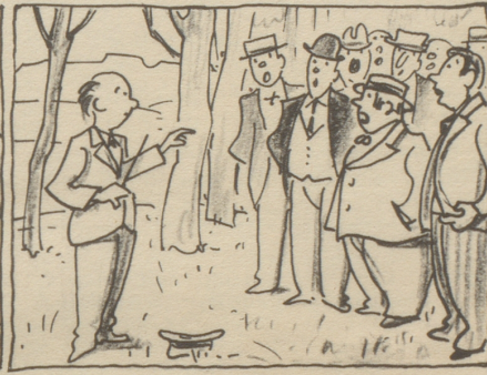
Der Männerchor in Wald es haut um singend dort sich auszutoben — Zu fragen wer ihn aufgebaut — den schönen Wald — so hoch da droben.