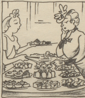
Nachdem die Predigt ist vorbei geht man in die Conditorei und kauft dort als ein braver Christ sich Stückli, weil es Sonntag ist.