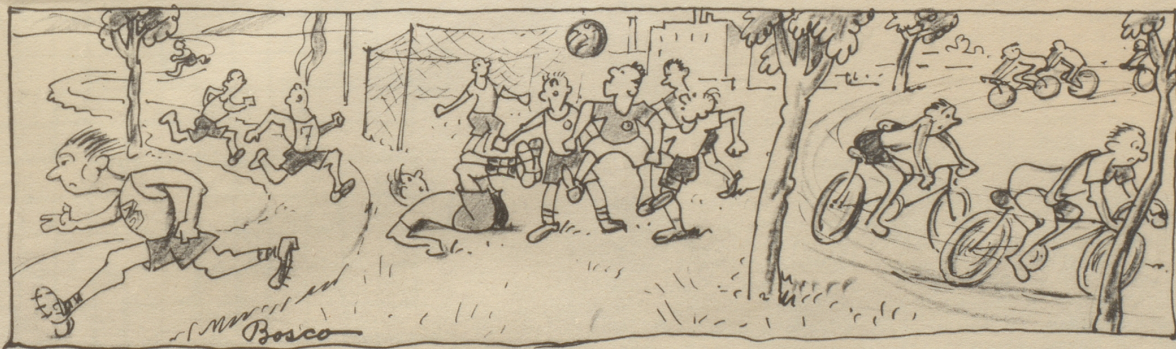
Die Jugend aber sportelt froh. Sie heiligt den Sonntag so. In jeder Stadt, in jedem Nest ist Sonntag und ein Muskelfest.