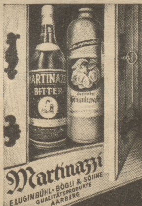
Martinazzi-Bar Mustermesse Basel Halle 14 Stand Nr. 4662