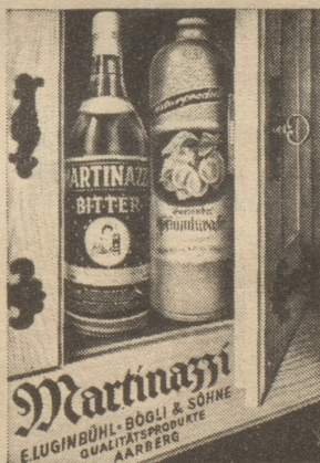
Martinazzi-Bar Mustermesse Basel Halle 14 Stand Nr. 4662