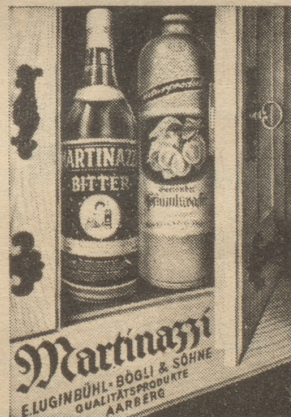
Martinazzi-Bar Mustermesse Basel Halle 14 Stand Nr. 4662