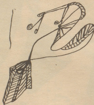
Ypssyps Ssaam an Lrak Ilkcöb, Snah Reahcs und Qu Qu Relgiez

Und die Apfelsinenzigarette Raucht sich durch das Oehr Einer Strohhalmpirouette Spiegelnd auf die Insel Föhr, Die des Wellenvogels Pflanze Sanft beringt vereinigt, In entsetzenskahlem Kranze Eine Wolke Kiesel reinigt. Sieh die Radiosinge röhren In des Busches Nadelzacken, Und die Geisterbleichen schwören Sich aus ihren Buschwindjacken. Endet Jammer diese Krause In der Täler Bergenenge Schreitest armend du nach Hause Ins Gedränge. Ypssyps Ssaam