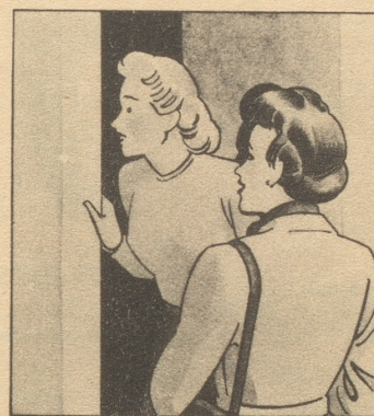
„Ist denn Ihrer auch noch nicht daheim? Bei dem schlechten Wetter holen sie sich gleich den Husten!“