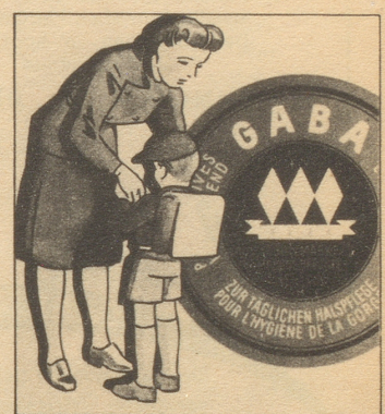
„Keine Angst, ich gebe dem Buben immer Gaba auf den Schulweg mit. Gaba schützt vor Husten und Heiserkeit.“