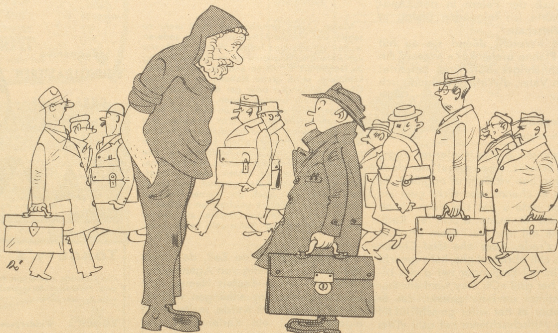
Toll begegnet 1948 seinem Walter.

Äxgüsi wänn ich wider öppis fröge, Bappe: Werum gasch Du veruse ohni Aktemappe?