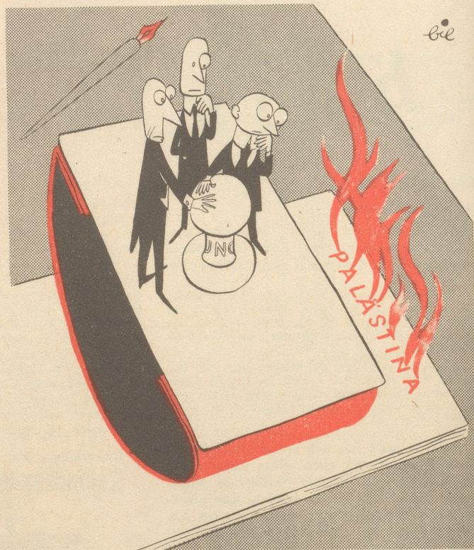
Mit Löschpapier nicht mehr zu löschen!