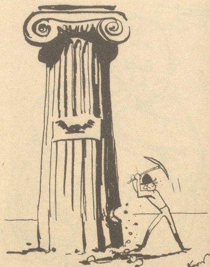
Die Rache des Wettbewerblers, dem nichts einfiel