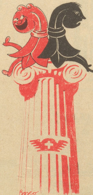
Die Zwei vereint auf einem Sitz Leider nur ein schlechter Witz!

Außer Konkurrenz: F. Boscovits, Zollikon