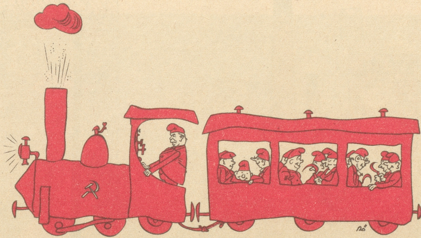
Der Zug nach Moskau

Als der Gottwald kam ans Ruder, Sahen wir ein ganzes Fuder Recken gegen Osten fahren Welche in der Hoffnung waren.