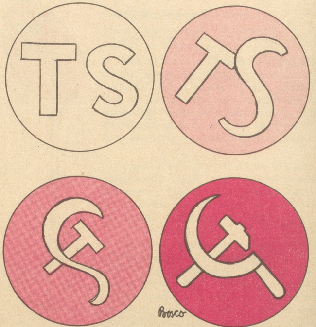
Metamorphose der Tschecho-Slowakei