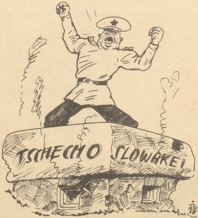
Wieder ein Bunker!