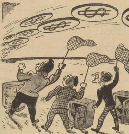
Die fliegenden Teller sind in Italien gesichtet worden.