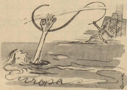
«Die Leuchtkugel»: das Rettungsseil.