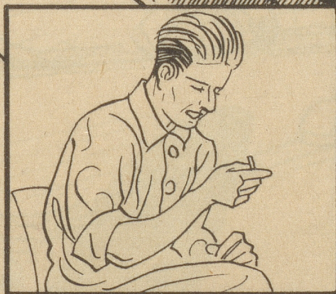
Der Filter ist dunkelbraun geworden.