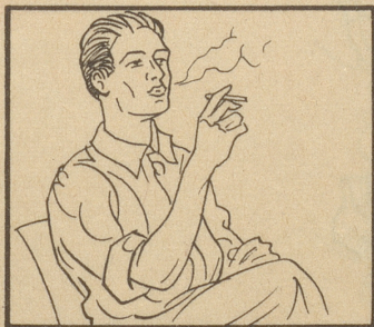
Rauchen Sie eine Marocaine Filter.