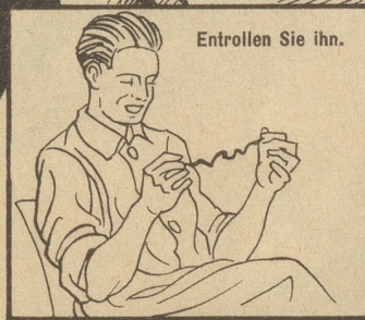
Entrollen Sie ihn.