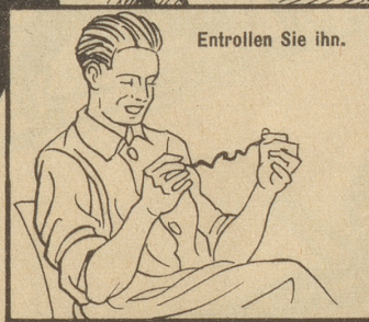
Entrollen Sie ihn.