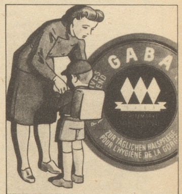
„Keine Angst, ich gebe dem Buben immer Gaba auf den Schulweg mit. Gaba schützt vor Husten und Heiserkeit.“