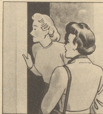
„Ist denn Ihrer auch noch nicht daheim? Bei dem schlechten Wetter holen sie sich gleich den Husten!“