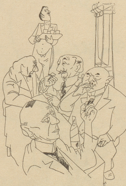
Bei der Abstimmung über das Kriegsächtungsgesetz im nordwürttembergisch-badischen Landtag bekundeten nur 46 von 100 Abgeordneten durch Anwesenheit ihr Interesse.

Es lebe das Velo der guten alten Tradition! V. O. C.