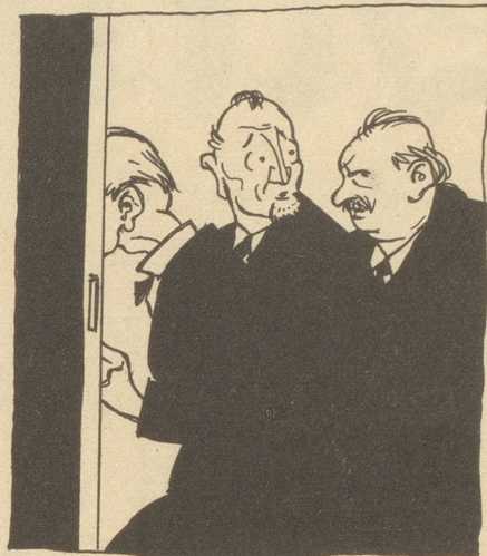
und die Abgeordneten CDE die Flucht!