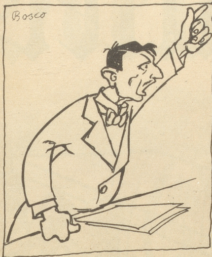
Der Abgeordnete A ergreift das Wort,