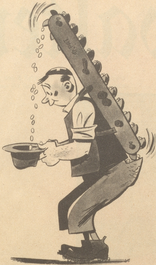
Die Aufwendungen des Bundes für die Verbilligung der Lebenskosten für 1948 = 259,3 Millionen Fr.