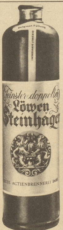
Erste Aktienbrennerei Basel

DAS BESTE FEUERZEUG Für höchste Ansprüche