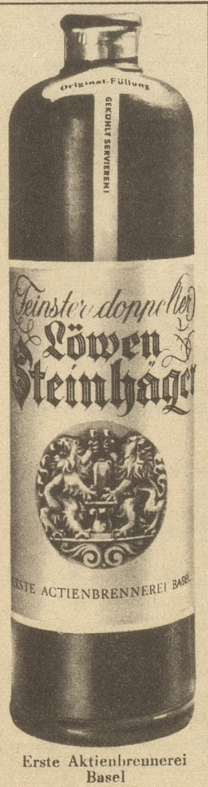
Erste Aktienbrennerei Basel

DAS BESTE FEUERZEUG Für höchste Ansprüche