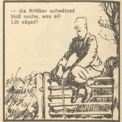
— die Kritiker schwätzed bloß noche, was alli Lüt säged!