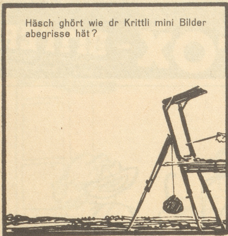
Häsch ghört wie dr Krittli mini Bilder abegrissne hät?