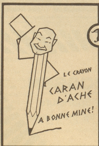
SCHWEIZERISCHE BLEISTIFTFABRIK CARAN D'ACHE GENÈVE