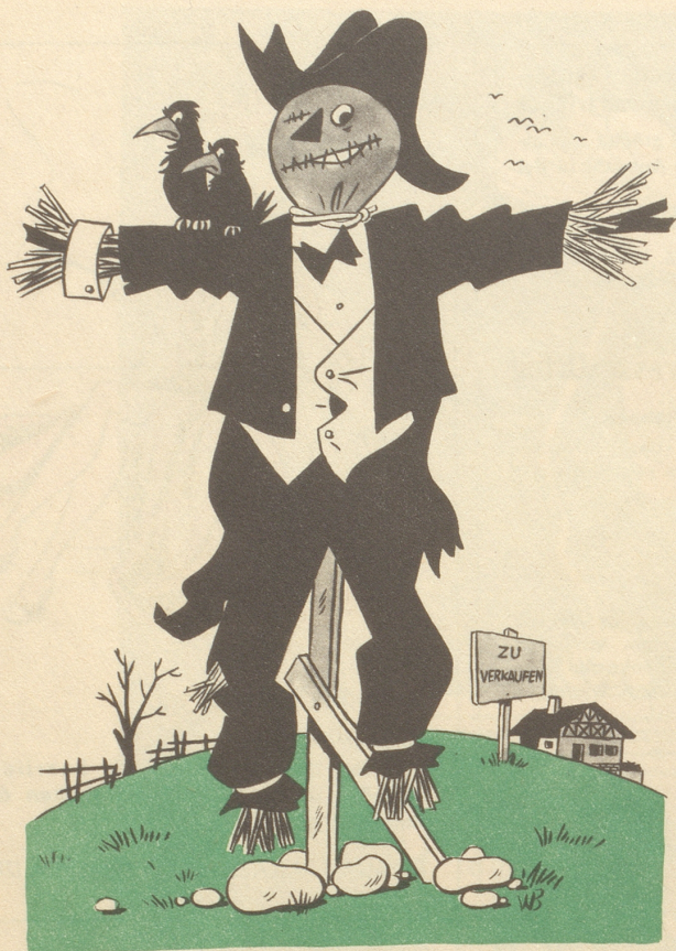
Das neue Bodenrecht Eine Käuferscheuche!