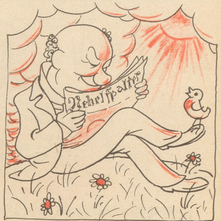
Der Nebelspalter verscheucht Sorgen!