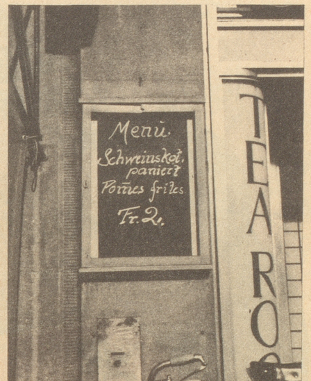
Lieber Nebelspalter, ich aß nicht hier. Dein Eg.