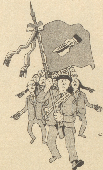
Die Bettelei der Vereine und Clubs nimmt überhand.

Er glaubt, der Schelm, ich könnte ihn Fortan nicht mehr entbehren. Er hat sich bei mir einquartiert, Und ich muß ihn ernähren. Nu