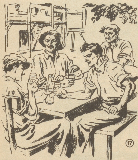
„Wämme mues swär saffe, eifagg“