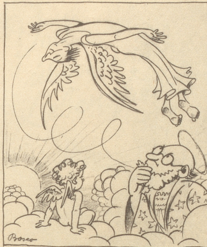
„Es isch halt en Akrobatik-Flüger!“