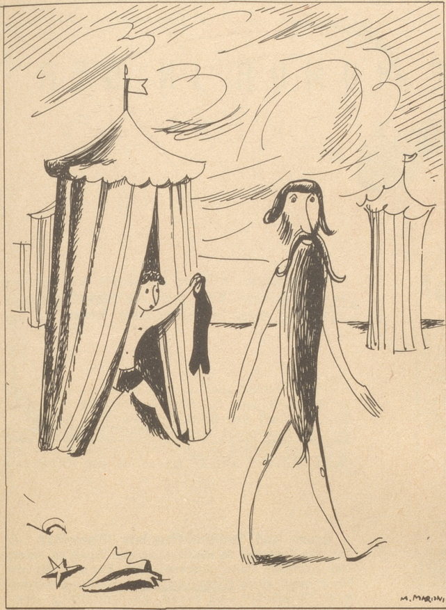
Bappe Du häsch Badhose vergässe!