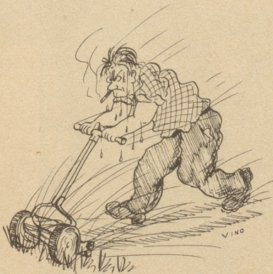
DER RASEN-(DE) MÄHER

Einmalig - Originell Heimelig Hafenkneipe Militärstraße 12 ZÜRICH