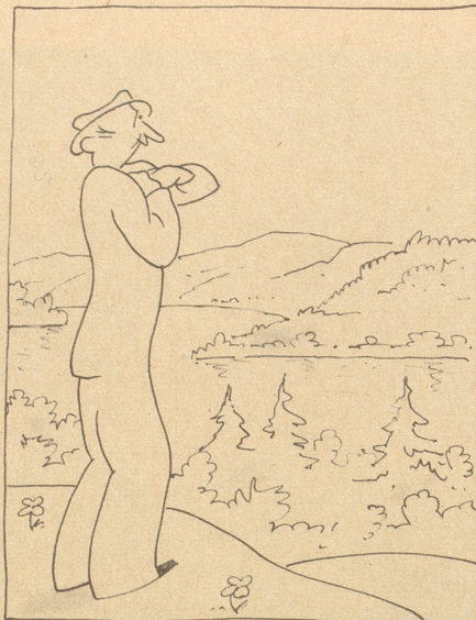
Sonne — oh Sonne! Du Licht und Wärme Spendende!