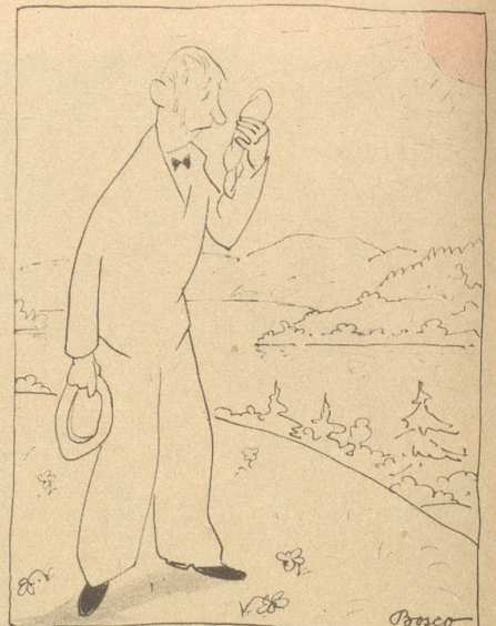
Herrschaft isch das e Säuhitz hüt!