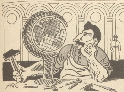
Heimindustrie im Kreml Söndagsnisse-Strix