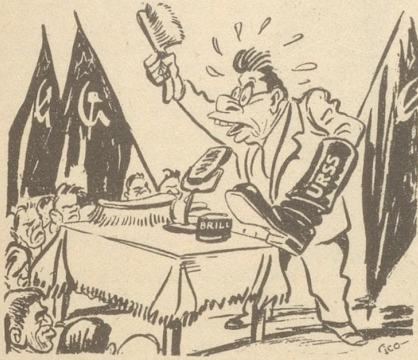
Togliatti: «Wir dulden keine Außenpolitik von Stiefelputzern...»