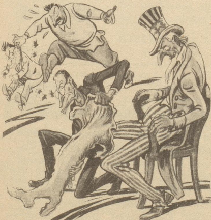
Der Schnurrbärtige: «Der Togliatti und der Nenni sind schuld, daß jener Stiefel nicht an meinem Fuß ist.»