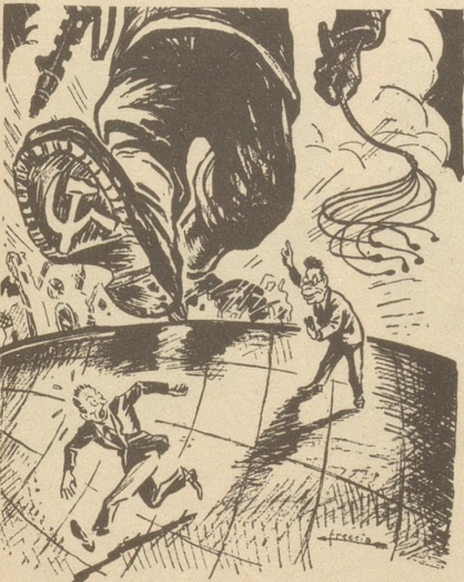
Togliatti: «Habe doch keine Angst; das ist nicht die Komintern, das ist die Kominform...»