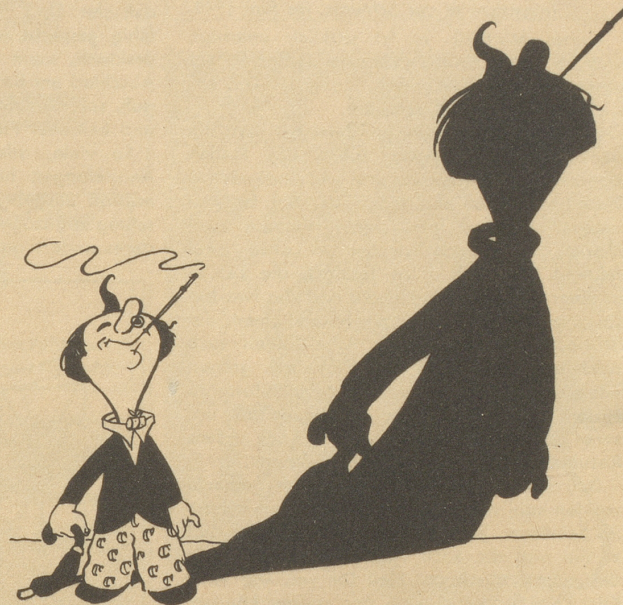
Casimir raucht Capitol

Achten Sie auf die Etikette mit dem Grapillon-Männchen — nur dann sind Sie sicher, Grapillon zu erhalten.