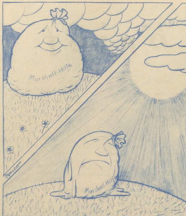
Sie gewinnt nicht durch das Lagern!