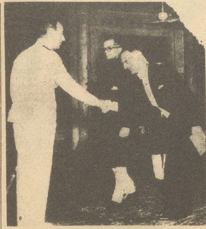
Der erste schweizerische Gesandte in Delhi hat seine Tätigkeit aufgenommen. Das Bild zeigt seinen Empfang beim früheren britischen Generalgouverneur in Indien, Lord Mountbatten (links).

is in ; a- arf nal reich fahr ung rige aren orten die den auf-