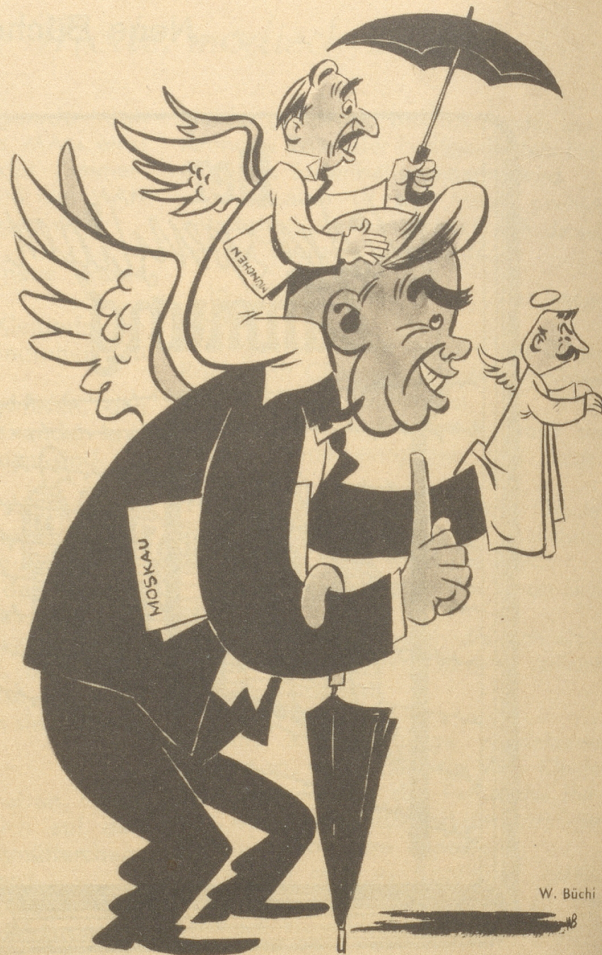
Wallace hielt eine Rede, in welcher er erklärte, Amerika sollte die Sowjetunion auffordern, die Ausbreitung des Kommunismus in andern Ländern einzustellen.