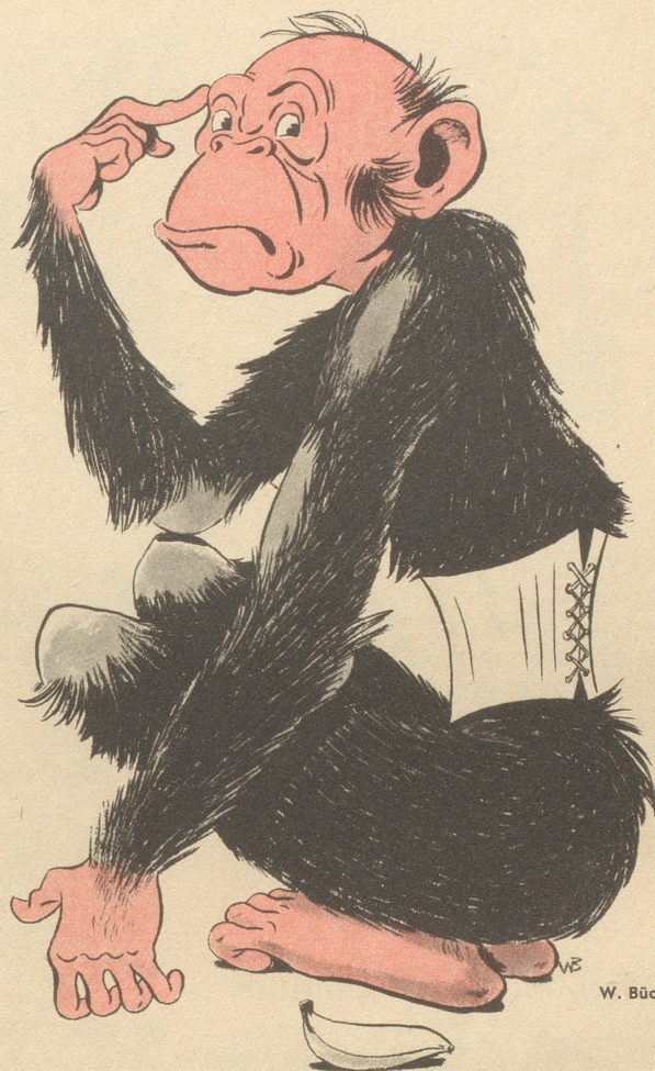
In Jacksonville in den Vereinigten Staaten wurden vierzig Affen mit einem Korsett versehen, das sie zwei Jahre tragen. Die Amerikaner wollen auf diese Weise Erfahrungen sammeln, ob der Schnürleib für die Gesundheit schädlich ist oder nicht.

Weg mit der Krawatte, weg mit schweren und dunklen Anzügen, wenn heißes Sommerwetter das Tragen mittelalterlicher Rüstungen geradezu ver-