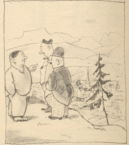
«So so, en Schtausee sötts da gä — schad isch es ja scho um euses Dorf — aber d'Allgemeinheit gaht natürlü vor — das begrüed eusi Dorfbewohner ohne wiiteres.»