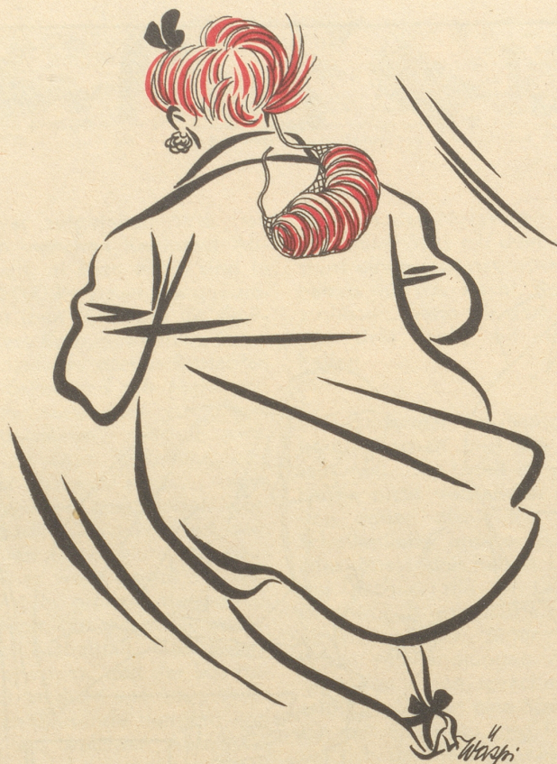
Die neue Haarmode Die ächten wieder obsi, die falschen nidsi.