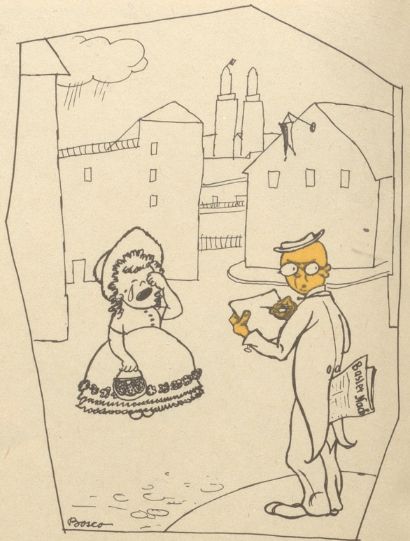
Welches ist der Unterschied zwischen Zürich und Basel? Die Zürcher verbrennen den Böögg, die Basler schicken ihn nach Zürich.