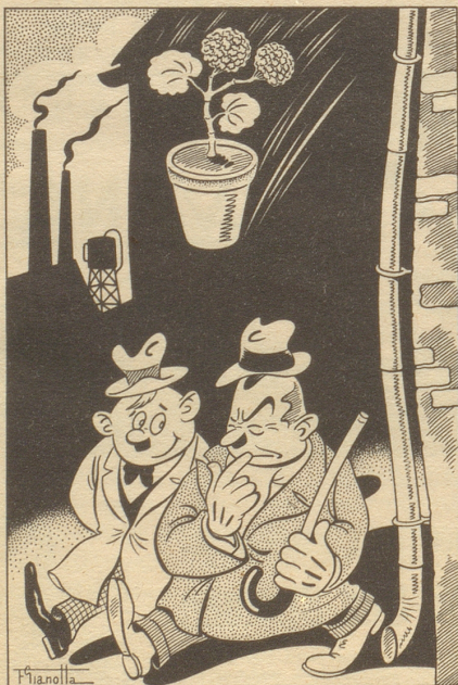
„Geranium ist meine Lieblingsblume.“