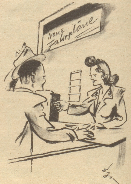
Essbebeliche Neuerung Zugkraft jetzt auch am Schalter!