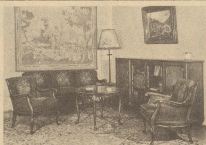
Einrichtungen in alten Stilarten Einzelanfertigungen und Kleinmöbel

Rohé & S. Zürich. Stilmöbel. frau-münsterstr. 23.